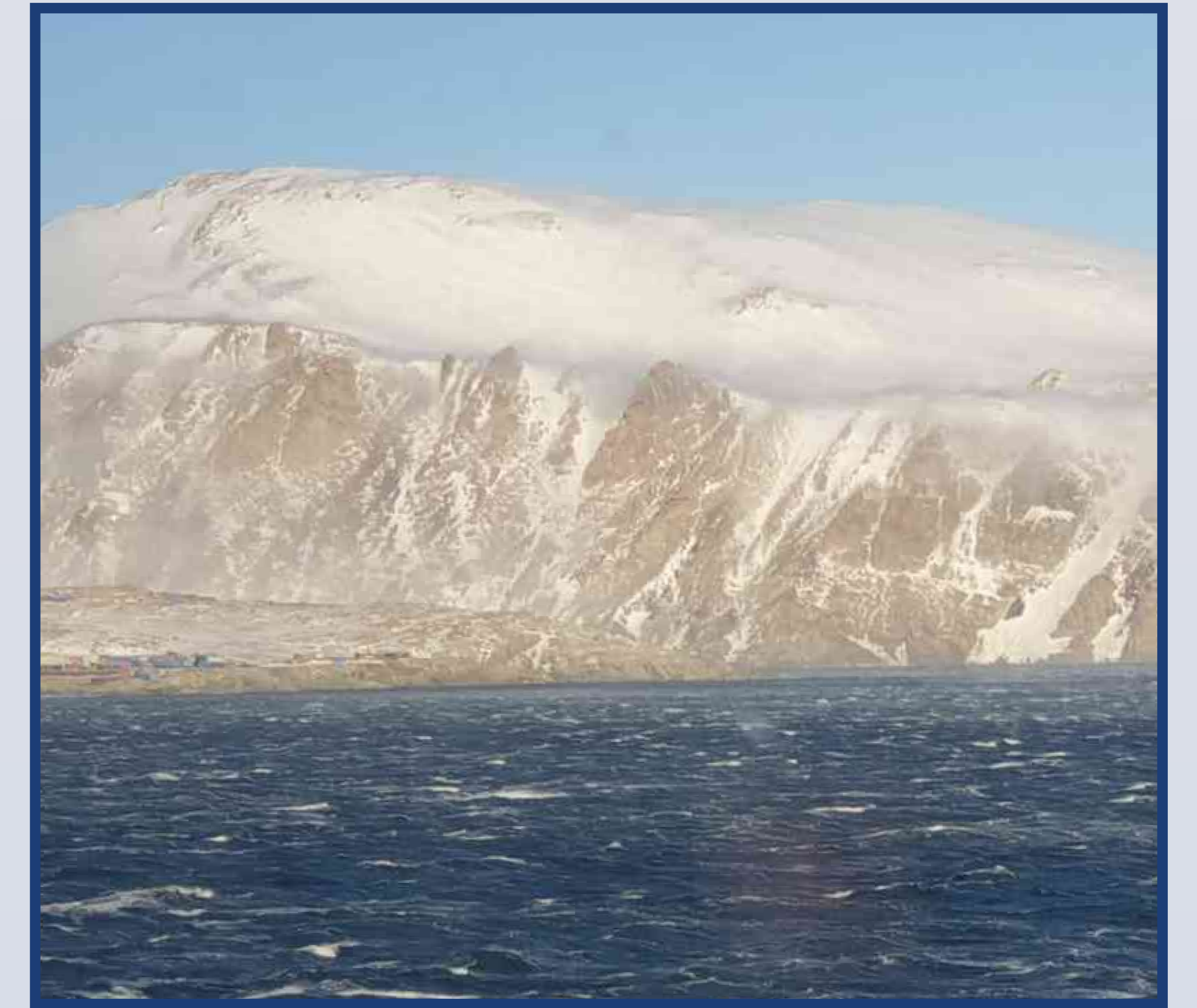
Vento catabatico sul Mare di Ross

Il trasporto di acque profonde fredde verso l'equatore e di acque superficiali calde verso i poli contribuisce alla redistribuzione del calore e all'assorbimento della CO 2 atmosferica.